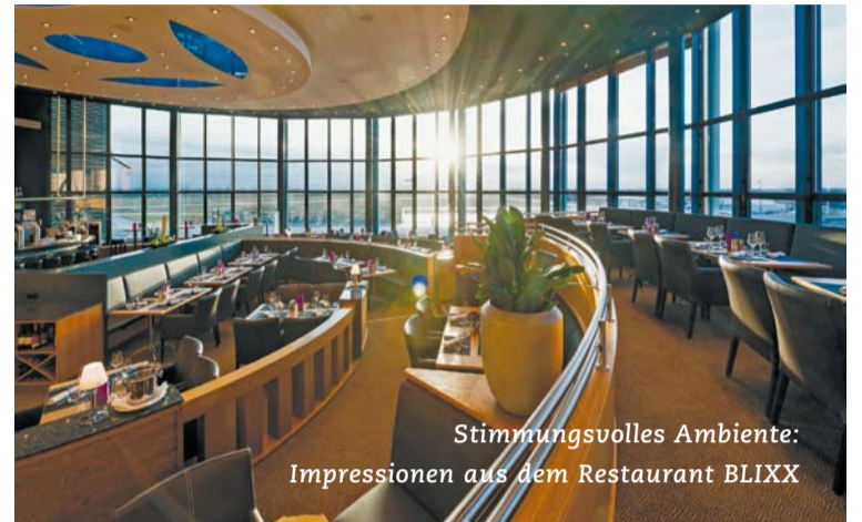
Stimmungsvolles Ambiente: Impressionen aus dem Restaurant BLIXX

Seit Juni dieses Jahres erwartet die Gäste ein weiteres Highlight im ATLANTIC Hotel Airport: In der Lobby geht es an Bord der ATLANTIC AIR, eines mobilen Flugsimulators in Kooperation mit protoura Events. „Damit ist das ATLANTIC Hotel Airport nicht nur das Hotel mit bester Flughafenlage, vielmehr können unsere Gäste und Kunden ab sofort auch direkt vor Ort im Hotel abheben...“, begeistert sich Direktor Tim Langer, der das Haus seit dem Jahr 2013 erfolgreich führt. +