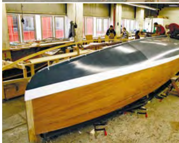
Bilder oben: Das Vegesacker „Schaufenster Bootsbau“ bietet ganzjährig spannende Einblicke in das traditionsreiche Handwerk rund um Bootsbau und Schifffahrt.