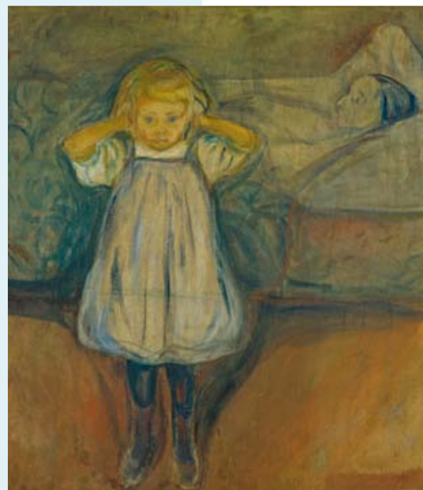
Edvard Munch „Das Kind und der Tod“, 1899 Öl auf Leinwand, 100 x 90 cm, Kunsthalle Bremen – Der Kunstverein in Bremen.

> www.kunsthalle-bremen.de , Buchung unter reservierung@atlantic-hotels.de