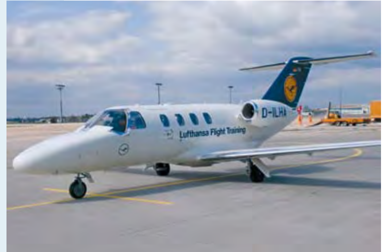
Einmal selber fliegen: diesen Wunsch kann man sich mit einem Schnupper-Training im Flugsimulator (beinahe) erfüllen

Die Rahmenprogramme, die im ATLANTIC Hotel Airport rund um Tagungen und Betriebsausflüge buchbar sind, stehen ganz im Zeichen der Luftfahrt. Neben Flughafenführungen, die Wissenswertes zur Fliegerei mit denkwürdigen Anekdoten aus dem City Airport Bremen verbinden, empfiehlt das Veranstaltungsteam ein ganz besonderes Highlight: In den Flugsimulatoren der Lufthansa-Schulflugzeuge können die Gäste so richtig abheben. Begleitet von einem Ausbildungspiloten nehmen sie auf dem Pilotensitz Platz und bringen eine Cessna Citation CJ1 Plus auf Reiseflughöhe. Wir sind uns sicher: Darauf werden Ihre Gäste fliegen! +