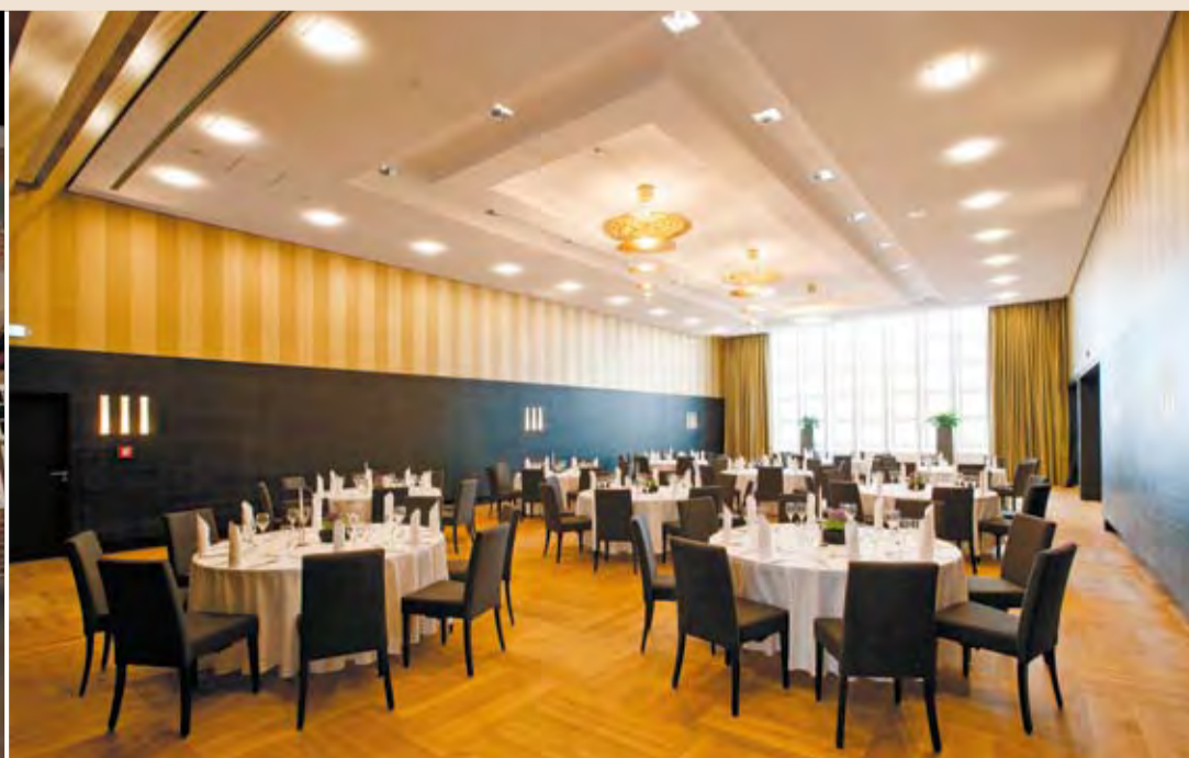
Fotos oben: Direktorin Ursula Carl und Stellvertreter Clemens Hieber mit Präsent bei der feierlichen Eröffnung und Konferenzraum „Zelt“; Fotos unten: Eingangsbereich in der Böttcherstraße und Goldener Saal