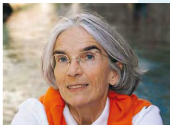
Donna Leon – Musikfest Bremen

Jetzt schon vormerken: Das nächste Musikfest Bremen findet vom 1.–22.09.2012 statt.