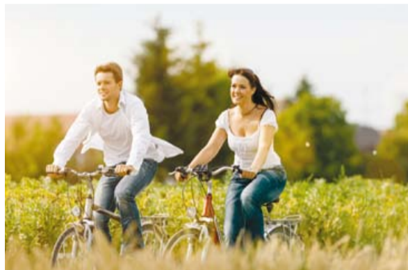
Stadt, Land, Weserfluss: Im Land Bremen kann man auch auf zwei Rädern eine Menge erleben.

Auch für diverse Radsportereignisse bietet Bremen mittlerweile die Kulisse, darunter die Bremen Challenge – ein Jedermann-Rennen für ambitionierte Hobbysportler, das am 18. August 2015 stattfindet. Zum zweiten Mal wird dabei auch die Brompton National Championship ausgetragen. Dort steht das Motto „Rennen, Falten, Fahren“ im Vordergrund, denn zugelassen sind ausschließlich Klappfahräder. Als Hommage an den britischen Radhersteller