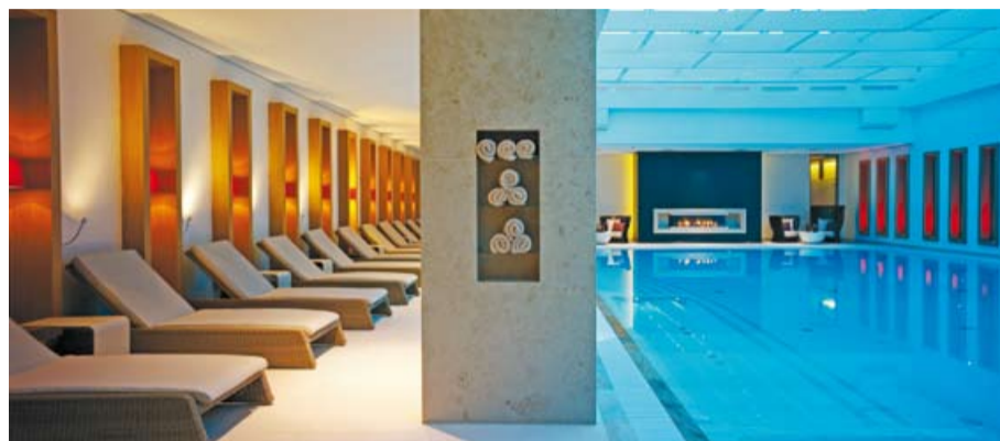
Das Severin*s Resort & Spa verbindet Exklusivität mit dem typischen, gediegenen Sylter Stil. Im Herzen der Insel erwartet Sie ein kinderfreundliches Sylter Hotel mit einzigartigem Komfort.